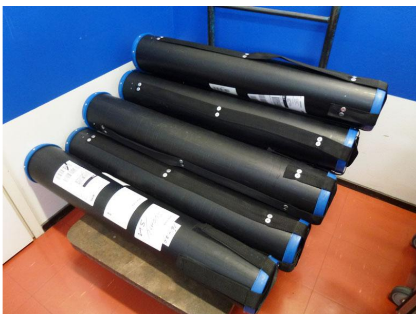
Lieriöt, joissa paneelit matkaavat. Lava ei kuulu lähetykseen.