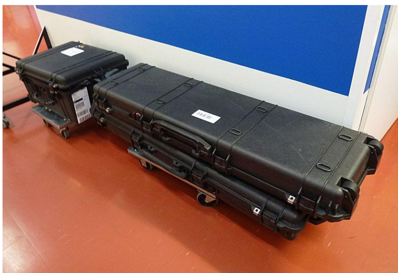
Kuvassa kaikki kolme "salkkua", joissa on telineiden osat. Rullakot eivät kuulu lähetykseen.