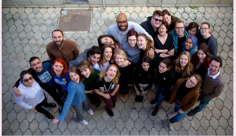
Youth for Peace -koulutuksen osanottajat ja ohjaajat